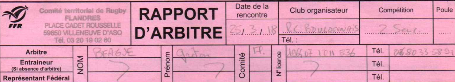
Figure sur les convocations de l'arbitre, des associations ou du représentant fédéral

N° de rencontre : 201718 | | | | | | | | | | RCT