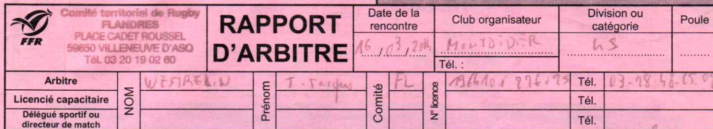
Figure sur les convocations de l'arbitre, des associations, du délégué sportif ou du directeur de match

N° de rencontre : 201314 | | | | | | | | | | RCT