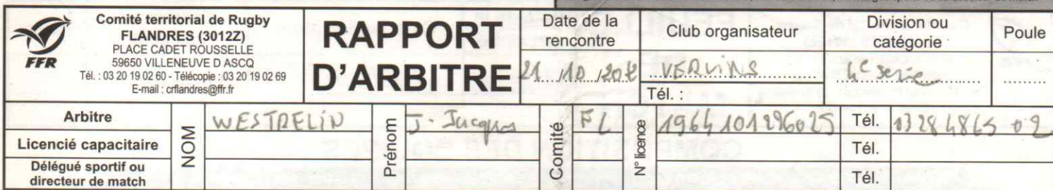
Figure sur les convocations de l'arbitre, des associations, du délégué sportif ou du directeur de match

N° de rencontre : 201213 | | | | | | | | | | RCT