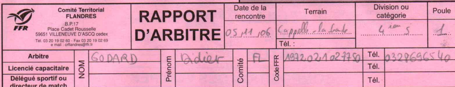
Figure sur les convocations de l'arbitre, des associations, du délégué sportif ou du directeur de match

A Equipe : GRAVELINES RÉSULTAT DU MATCH B Equipe : RC Thierache