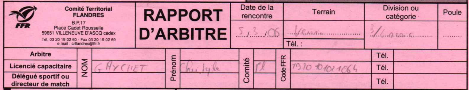
Figure sur les convocations de l'arbitre, des associations, du délégué sportif ou du directeur de match

N° de rencontre : 200506 [ ] [ ] [ ] [ ] [ ] [ ] [ ] [ ] [ ] [ ] [ ] [ ] RCT