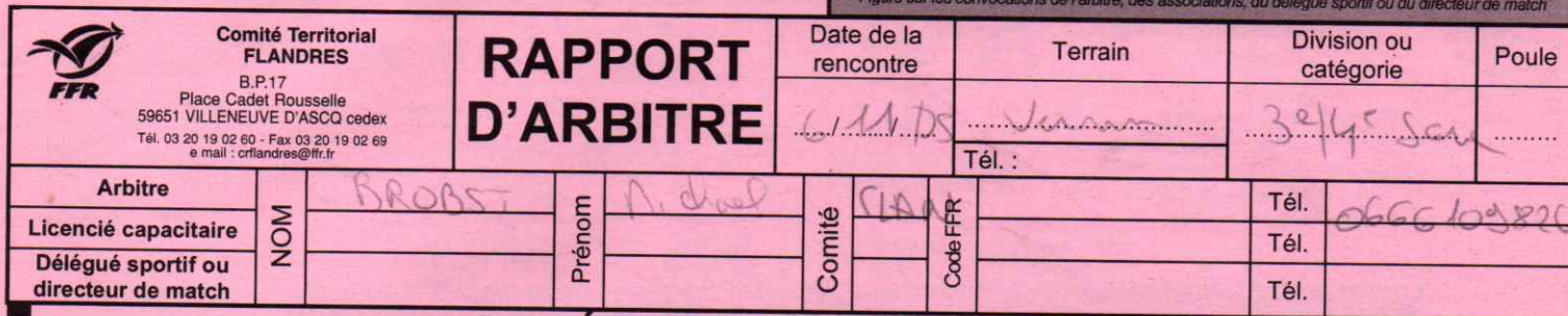
Figure sur les convocations de l'arbitre, des associations, du délégué sportif ou du directeur de match

N° de rencontre : 200506 [ ] [ ] [ ] [ ] [ ] [ ] [ ] [ ] [ ] [ ] RCT