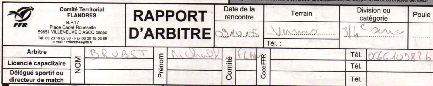
Figure sur les convocations de l'arbitre, des associations, du délégué sportif ou du directeur de match

A Equipe : RC Thierache RÉSULTAT DU MATCH B Equipe : Carvin