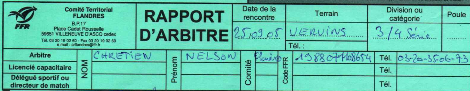
Figure sur les convocations de l'arbitre, des associations, du délégué sportif ou du directeur de match

N° de rencontre : 200506 [ ] [ ] [ ] [ ] [ ] [ ] [ ] [ ] [ ] [ ] RCT