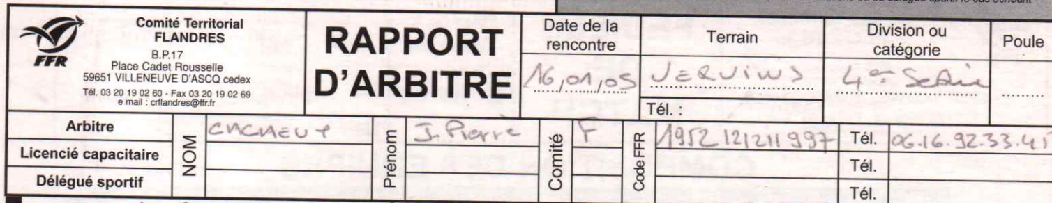
Figure sur les convocations de l'arbitre, des associations ou du délégué sportif le cas échéant

N° de rencontre : 200405 [ ] [ ] [ ] [ ] [ ] [ ] [ ] [ ] [ ] [ ] RCT