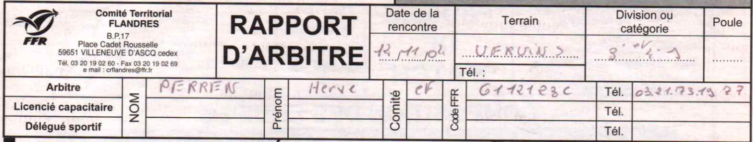
Figure sur les convocations de l'arbitre, des associations ou du délégué sportif le cas échéant

N° de rencontre : 200405 [ ] [ ] [ ] [ ] [ ] [ ] [ ] [ ] [ ] [ ] RCT