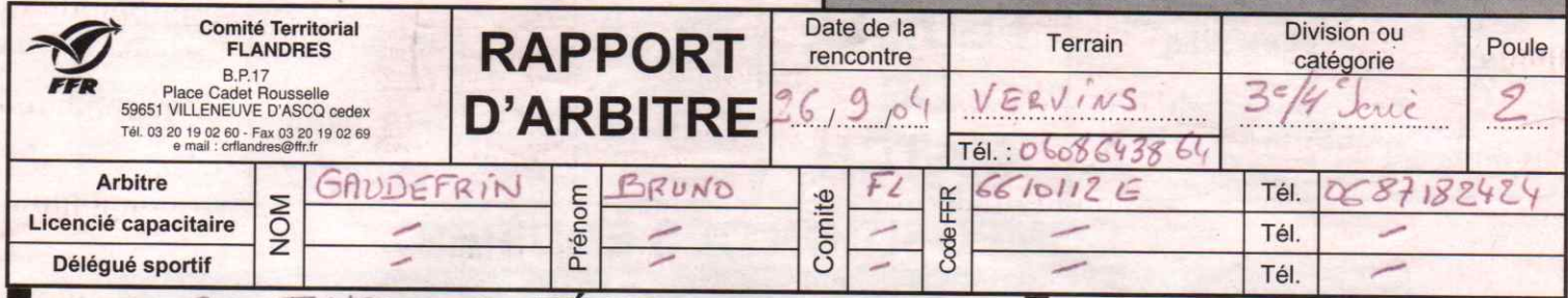
Figure sur les convocations de l'arbitre, des associations ou du délégué sportif le cas échéant

N° de rencontre : 200405 [ ] [ ] [ ] [ ] [ ] [ ] [ ] [ ] [ ] [ ] RCT